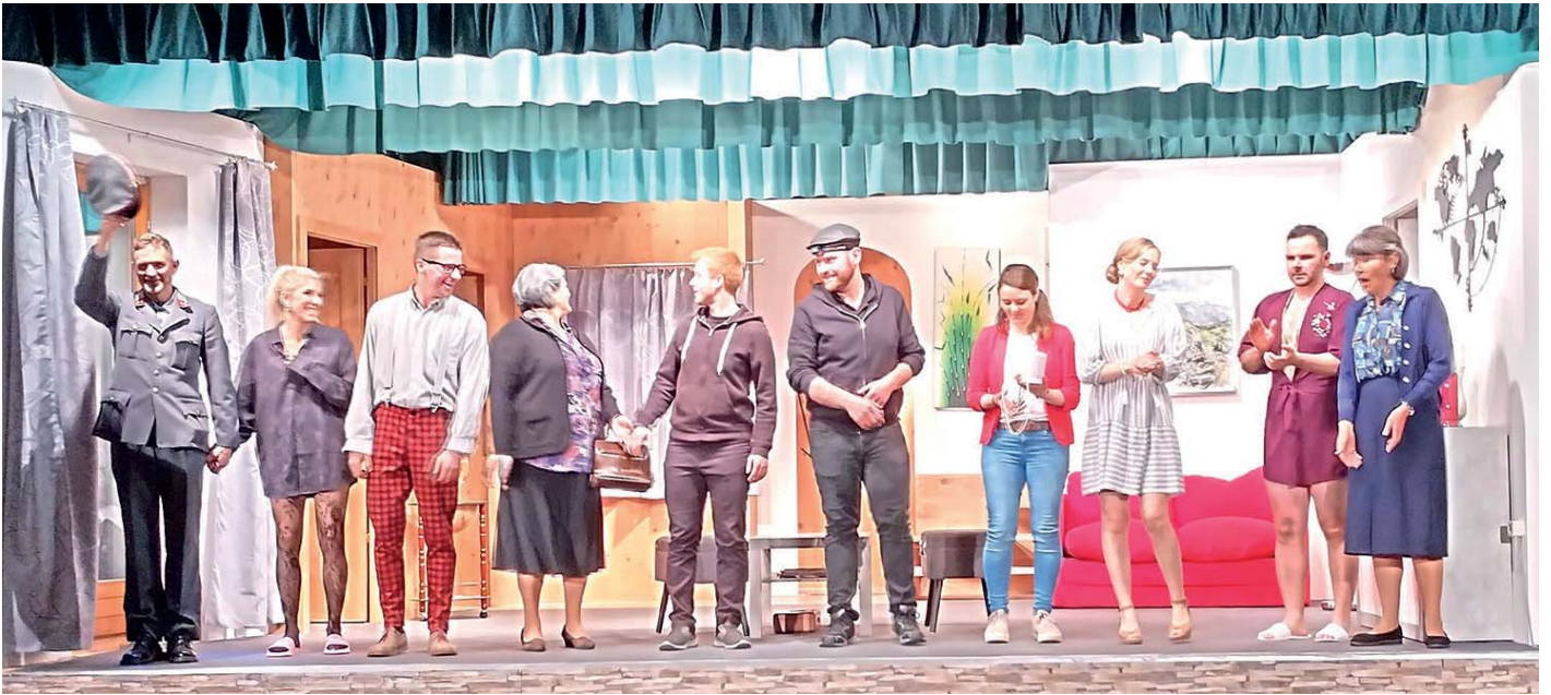
Generalprobe der Dorfbühne Itter