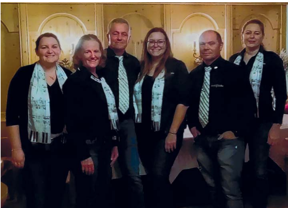
Der neu gewählte Vorstand.