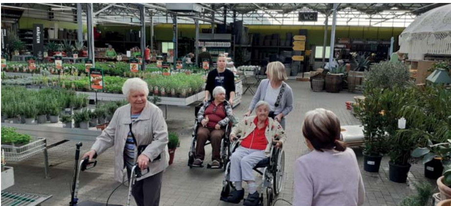
Ausflug zum Hödnerhof

Vielen Dank an alle Mitwirkenden, die unseren BewohnerInnen diesen wunderbaren Tag geschenkt haben.