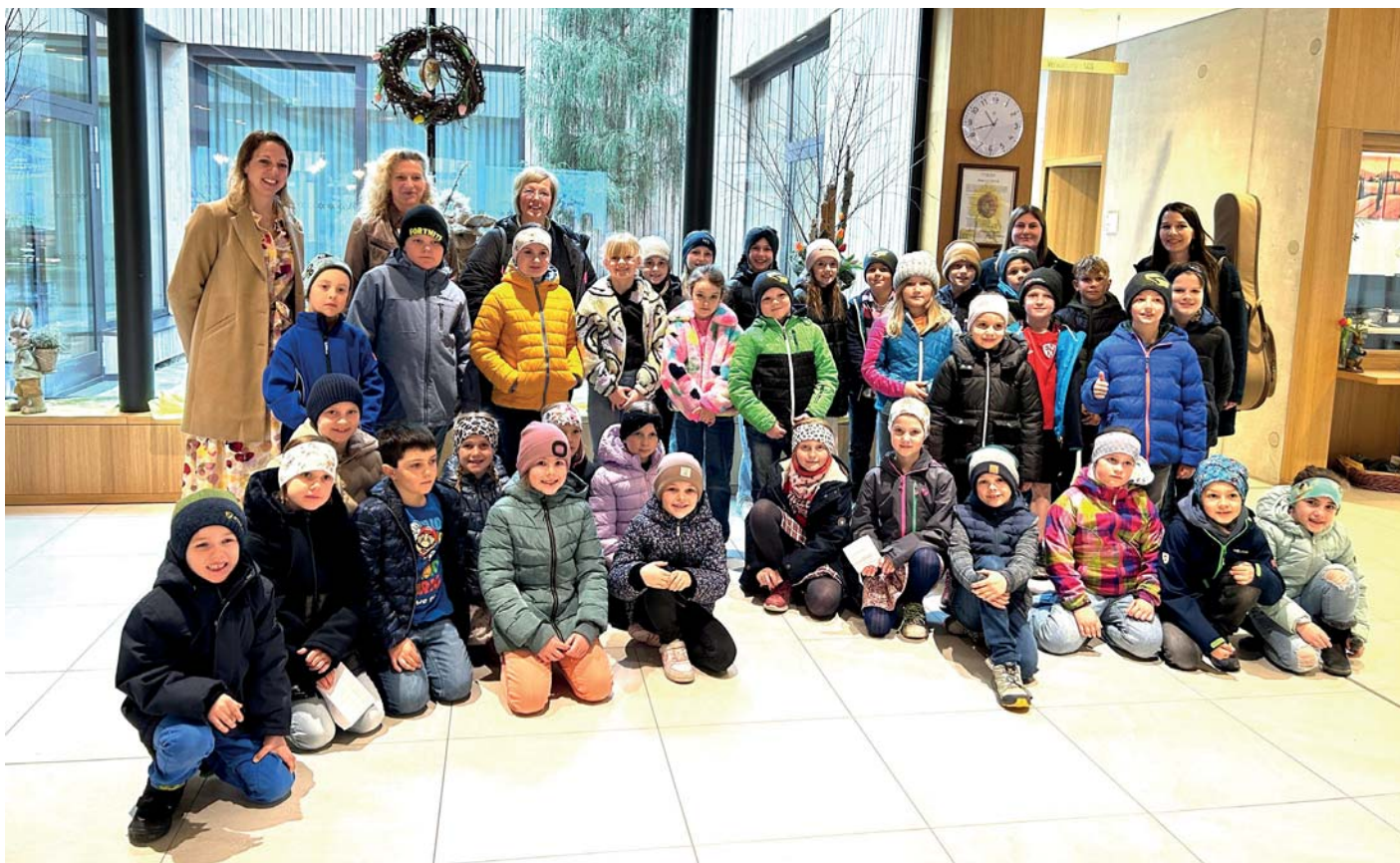
Lesevormittag der Itterer Volksschüler

Vielen Dank für Euren Besuch. Uns, und auch unsere BewohnerInnen hat es sehr gefreut.