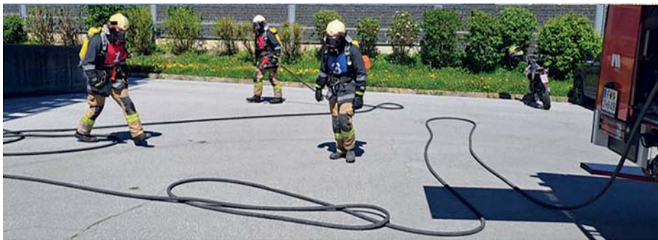
Kameraden der FF Itter nach bestandener Leistungsprüfung (oben); Gold-Trupp im Einsatz bei den Stationen zur Menschenrettung (Mitte) und zur Brandbekämpfung (unten).