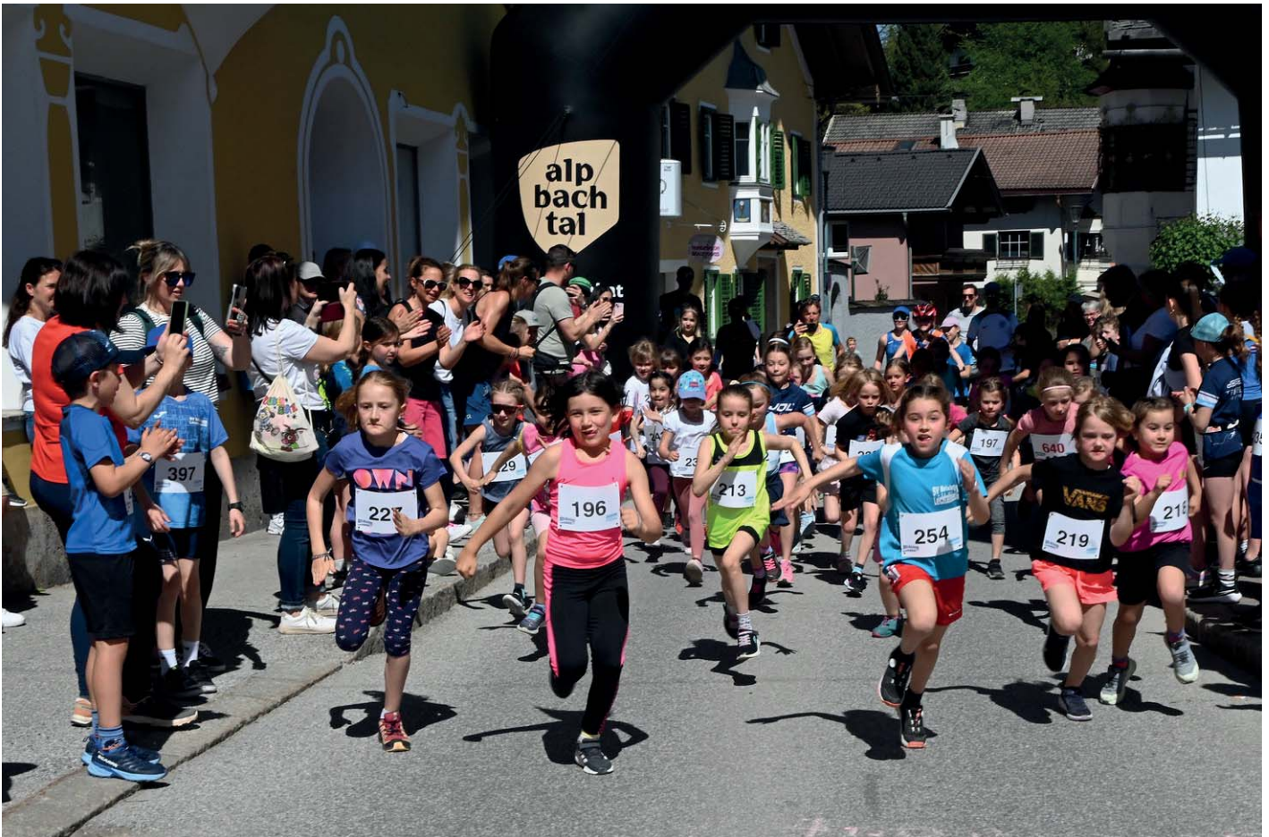
Kinderlauf in Brixlegg

Ereignisreiche Tage standen für die AthletInnen der LG Decker Itter an. Die letzten Wochen waren, wie üblich im Frühjahr, Hochsaison für die LäuferInnen in Tirol.