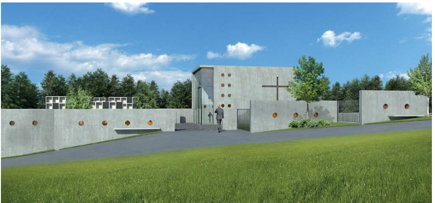
Die Ansicht des neuen Friedhofs zeigt die Aufbahrungshalle mit Begrenzungsmauern und Urnenwänden.