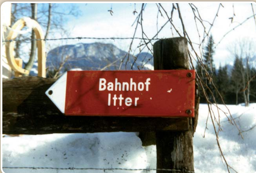
Bahnhof in Gries, 1982